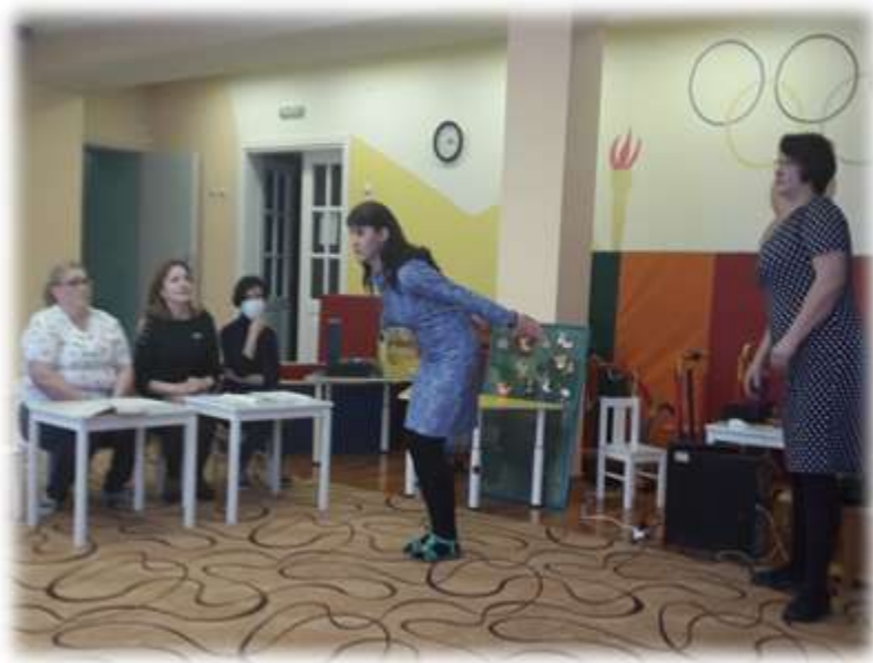
Презентация гимнастики «Маленький волшебник»

Участники мастер-класса, члены творческой группы, выступили в роли родителей, участников «круглого стола», презентовав в ходе мероприятия собственный опыт воспитания детей в условиях дома