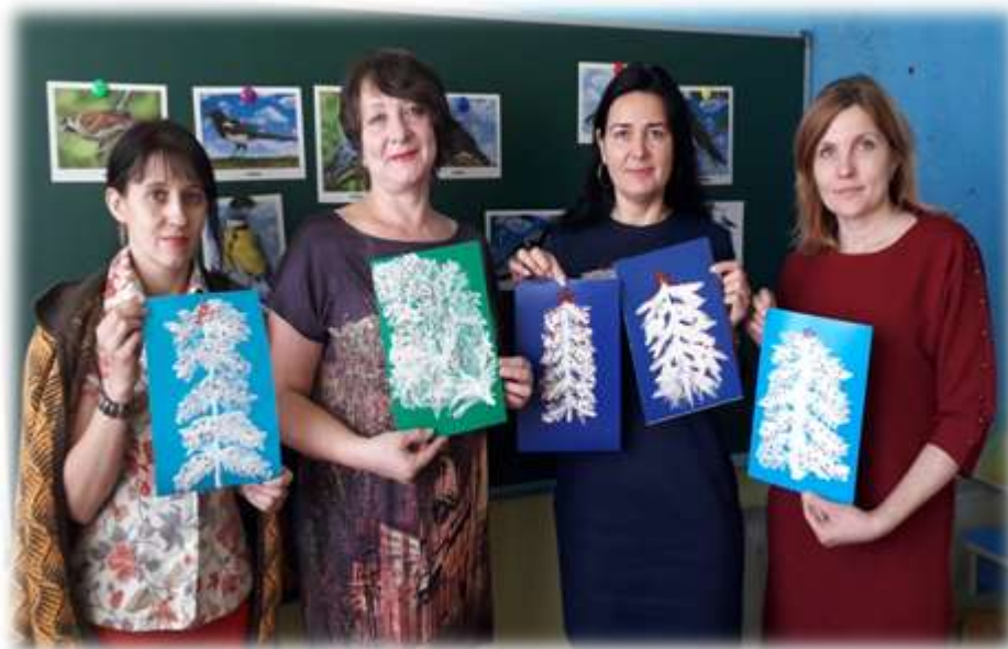
Прекрасный итог творческого замысла