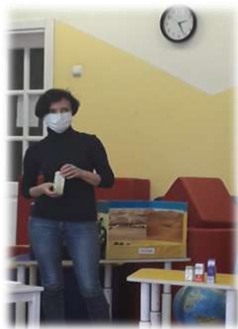
Презентация ароматерапии в домашних условиях