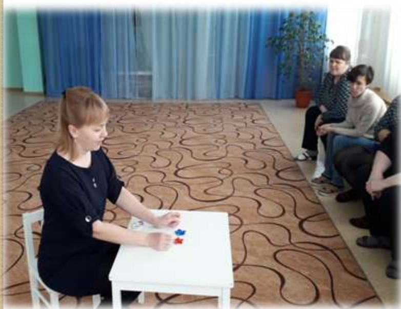
Дидактическая игра «Разложи цифры»

Все дидактические игры педагог изготовила своими руками из ткани, фетра и картона. • Присутствующие на мастер-классе педагоги проиграли в предложенные игры