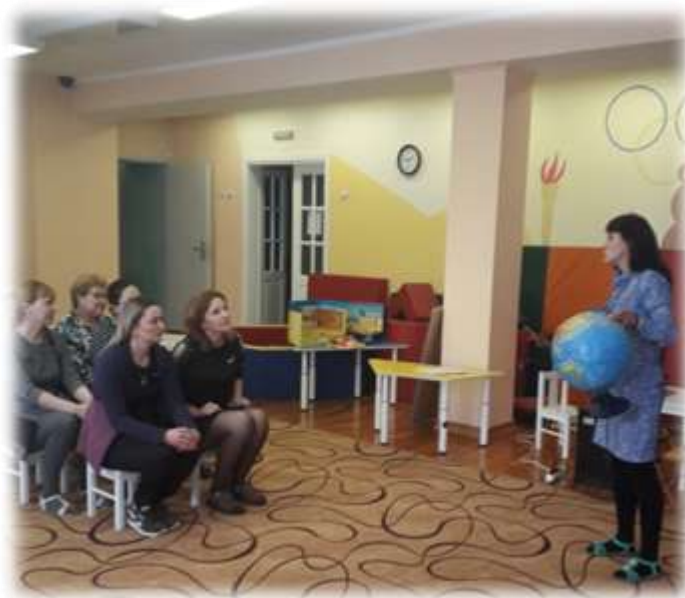
Участники мастер-класса «отправляются» в путешествие по Африке