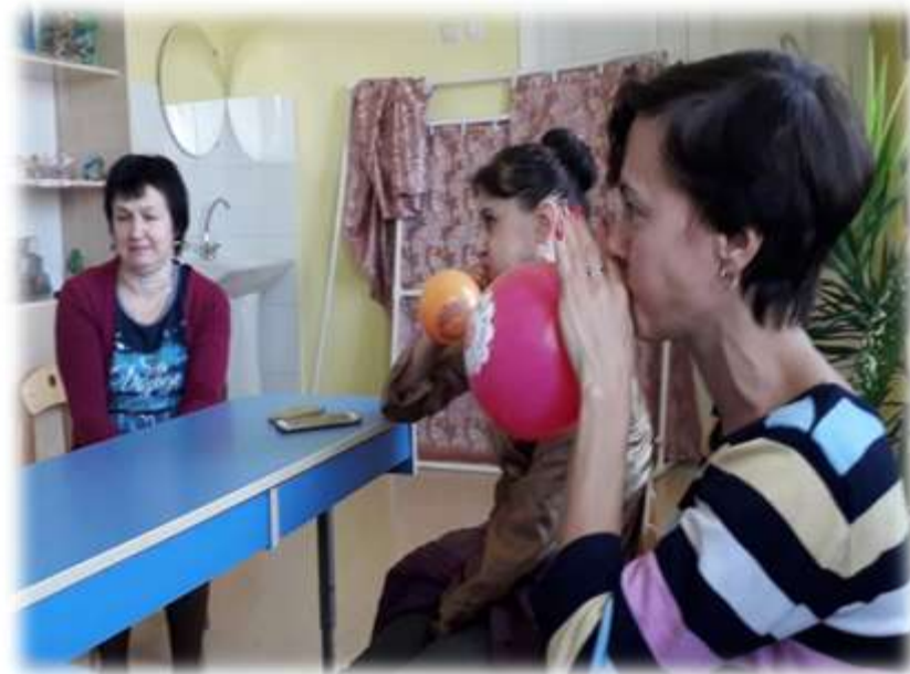
Упражнение «Выдохни всю злость»