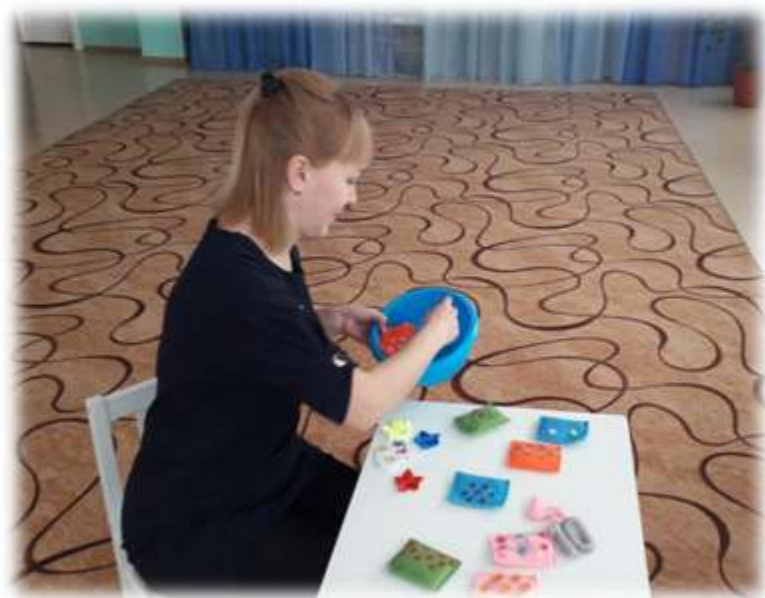
Дидактическая игра «Угадай, где лежит?»