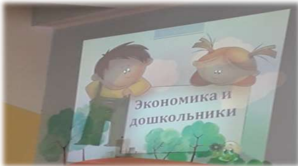
Презентация к докладу