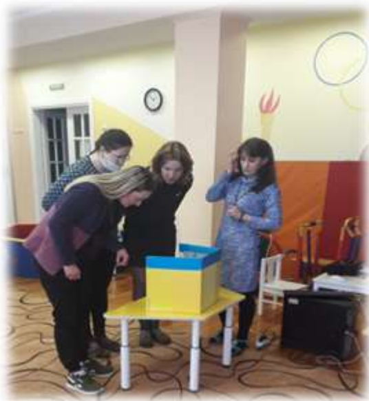
Участники мастер-класса рассматривают макет пустыни

Используя мультимедийную презентацию, дидактически игры и пособия (макеты пустыни, джунглей и саванны) воспитатель раскрыла методы и приемы организации образовательной деятельности в области познания