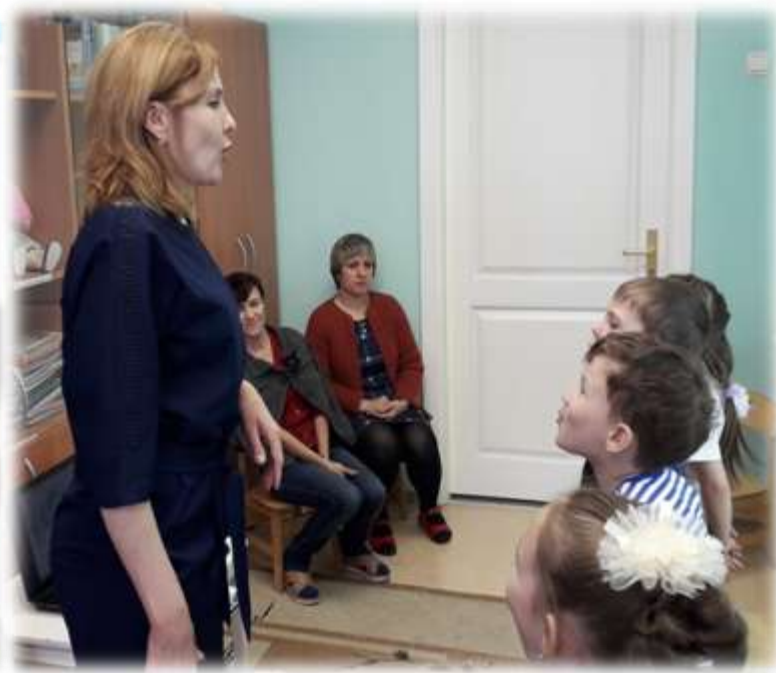
Дыхательное упражнение «Вьюга»