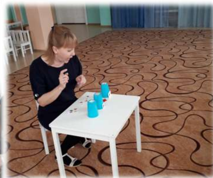
Дидактическое пособие «Логические стаканчики»