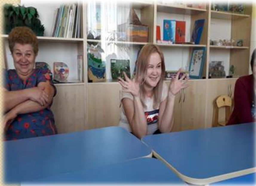
Упражнение «Злая собака»

Участники мастер-класса на практике проиграли упражнения, снижающие агрессивность детей по отношению друг к другу, и, напротив, повышающие дружелюбные взаимоотношения