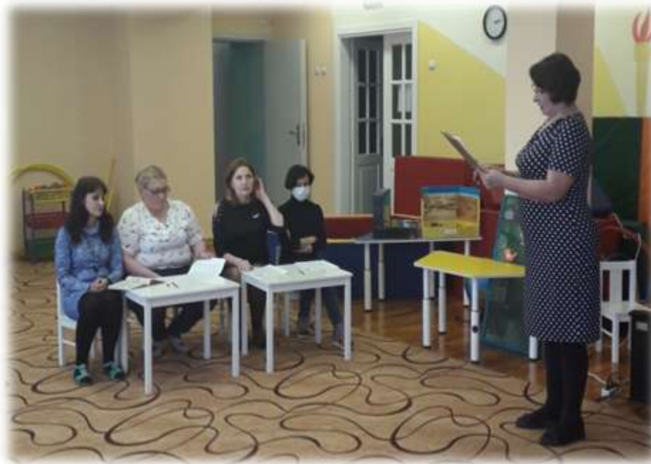
Работа с участниками дискуссии