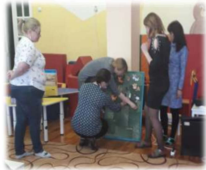
Дидактическая игра «Чей хвост?»