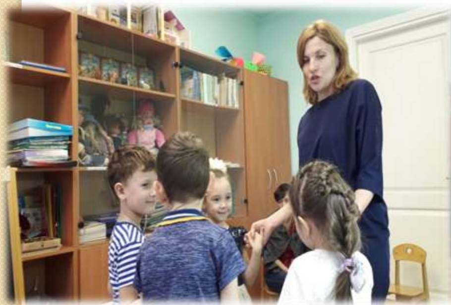
Установление эмоционального контакта в начале занятия