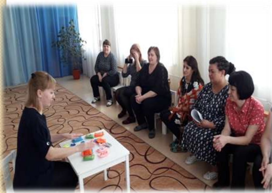
Дидактическая игра «Сосчитай»