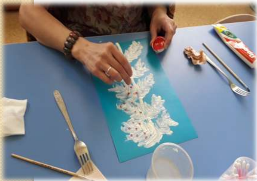
Творческий процесс рисования

В результате участники мастер-класса получили эстетическое наслаждение. Педагоги на практике применили в дальнейшем эту нетрадиционную технику рисования в своей группе