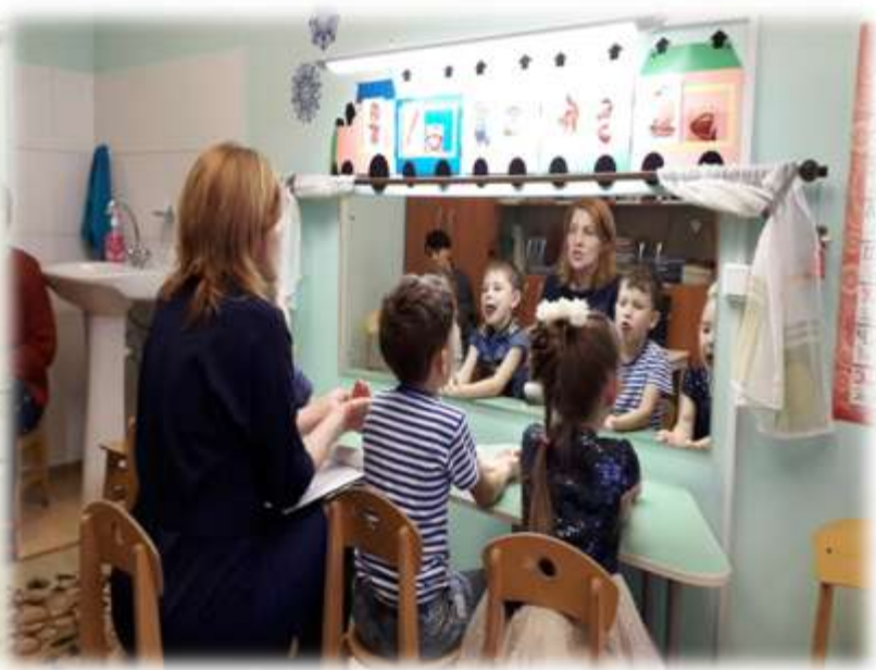
Артикуляционная гимнастика перед зеркалом