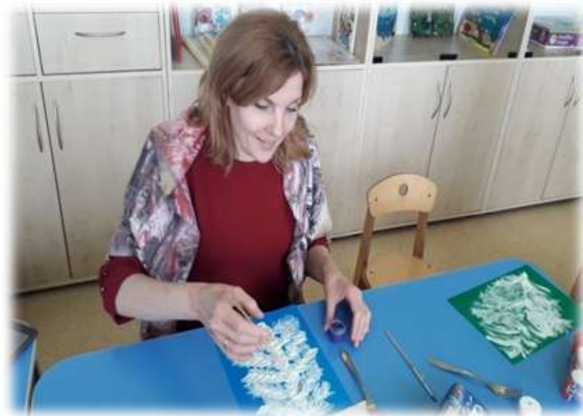
Один из участников мастер-класса