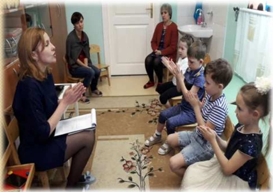
Массаж пальцев лесными орехами

Большое внимание на коррекционном занятии уделялось развитию мелкой моторики и правильного речевого дыхания