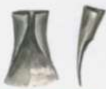
Железные лопаты из Михайловских курганов