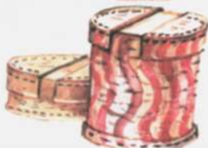
Вересковые туеса таштыков