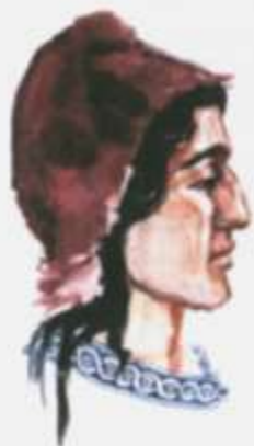
Так выглядели таштыки (реконструкция художника)