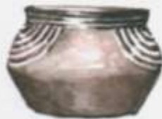
Глиняный горшок из Шестаковского кургана