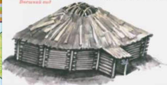
Жилища таштыков. Внешний вид

Великое переселение народов началось с появлением в Центральной Азии гуннов. Гуннов запомнили как воинственных и свирепых кочевников. Они покорили многие народы от Китая до Римской империи. Нашествие гуннов привело к тому, что многим народам пришлось покинуть свои земли и переселиться в другие. Поэтому гуннское время назвали «эпохой переселения народов».