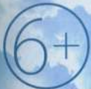
Иллюстрация: Виктория Мухоморова