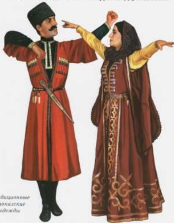
Традиционные кавказские одежды

Отдельно стоящие башни обычно имели три-четыре этажа, хотя попадаются и семярусные. Деревянные пе-