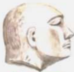
Глиняная голова. Шестаковский курган

Таштыкская эпоха заканчивается в V веке.