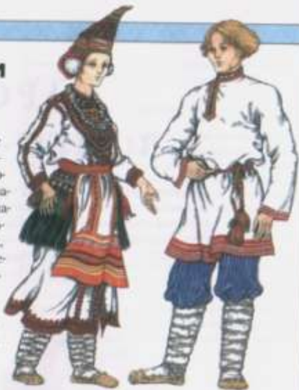
Мордовский мужской и женский праздничные костюмы

Народ мордва живет в Среднем Поволжье в Республике Мордовия. Его численность — 1,2 млн. человек. Многим кажется, что «мордва» — какое-то странное слово. Часто спрашивают, откуда оно происходит, что означает. Оказывается, все очень просто: на древнеперсидском языке «морд» — это «человек, мужчина», а частица «-ва» — признак множественного числа. Значит, слово «мордва» означает «много людей». Плодородные долины Оки и Волги более всего располагали к занятиям рыболовством и земледелием. Соответственно мордва были в основном рыбаки, пахари, животноводы и охотники. Все праздники у мордвы связаны с их хозяйственными занятиями.