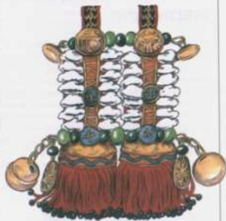
Панное женское украшение